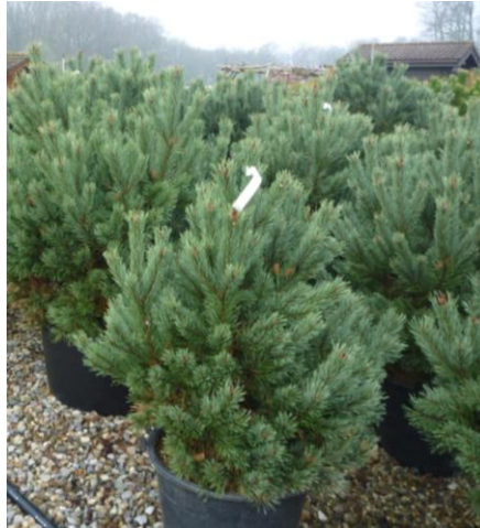
Pinus sylvestris 'Watereri'