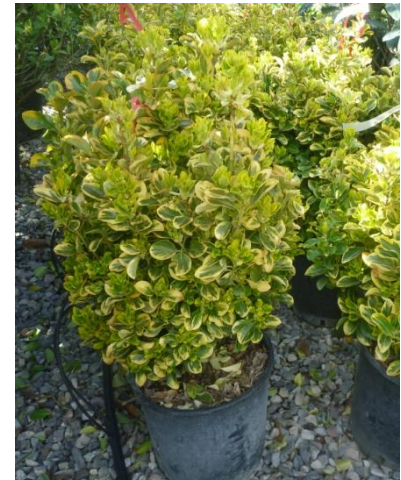
Euonymus japonicus 'Sorten'

Diese Zusammenstellung soll einige Ideen geben, ist aber keinesfalls abschliessend.