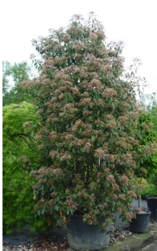
Photinia fraseri 'Red Robin'