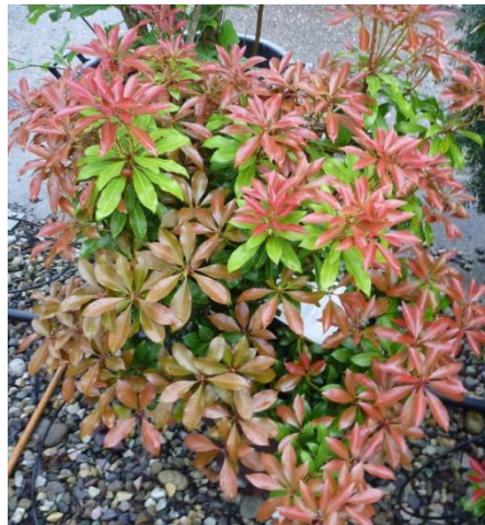
Pierris japonica 'Forest Flame'