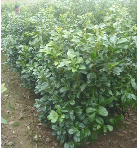
Prunus laurocerasus 'Sorten'