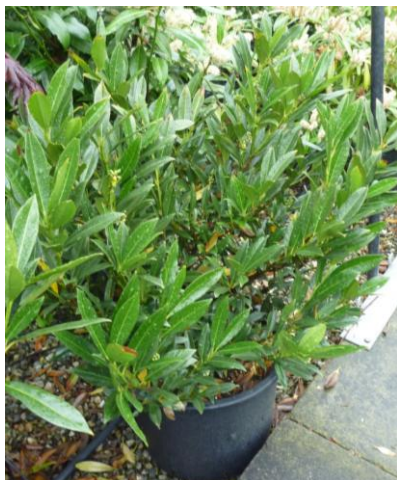
Prunus laur. 'Otto Luiken'