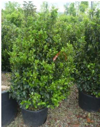
Viburnum tinus 'Eve Prince'